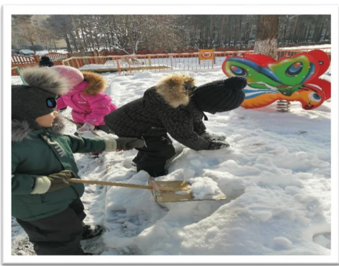
27.02 - День белого полярного медведя