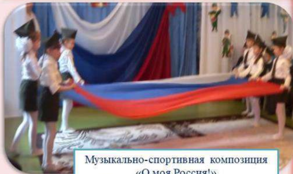
Музыкально-спортивная композиция «О моя Россия!» Подготовительная группа №1

Должен Родину, как мать, Ты беречь и защищать!