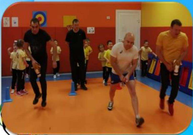
Наши папы молодцы, наши папы удалцы!

Команда: «Спортивные ребята» Девиз: «Все мы спортом заниматься любим с самого утра! И приветствуем, ребята, громким вас «Физкульт-ура»