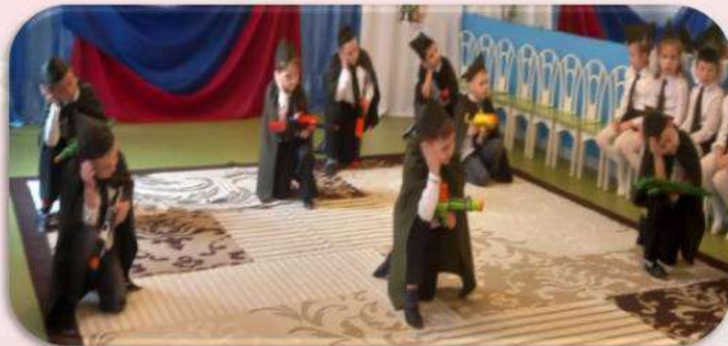
Танец «Пацаны стоят в строю» Подготовительная группа №2