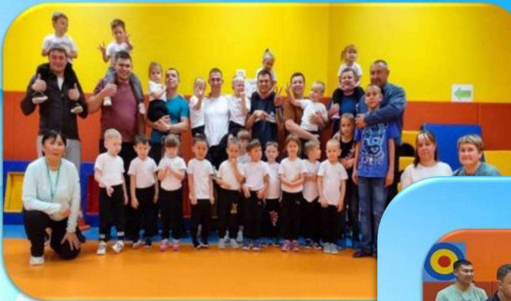
Средняя группа №2 «Пчелки»

Девиз: «Чтоб расти нам сильными, ловкими и смелыми, Ежедневно по утрам! Мы зарядку делаем!».