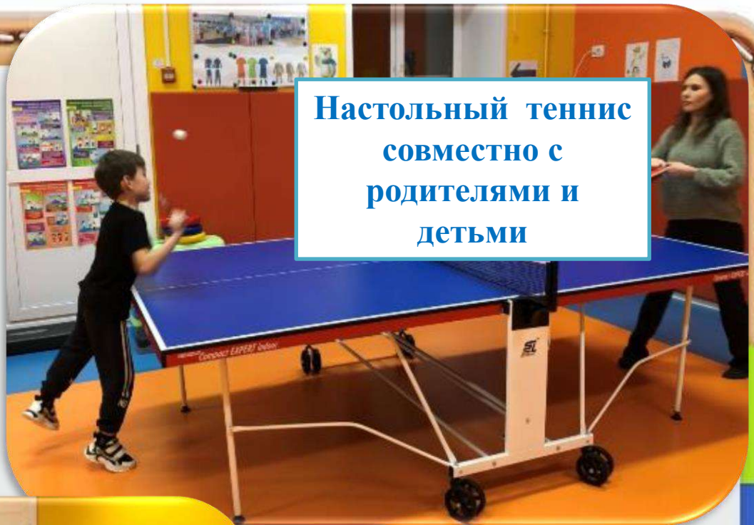
Настольный теннис совместно с родителями и детьми