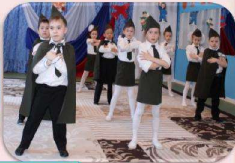
Спортивная композиция «Служить России!»