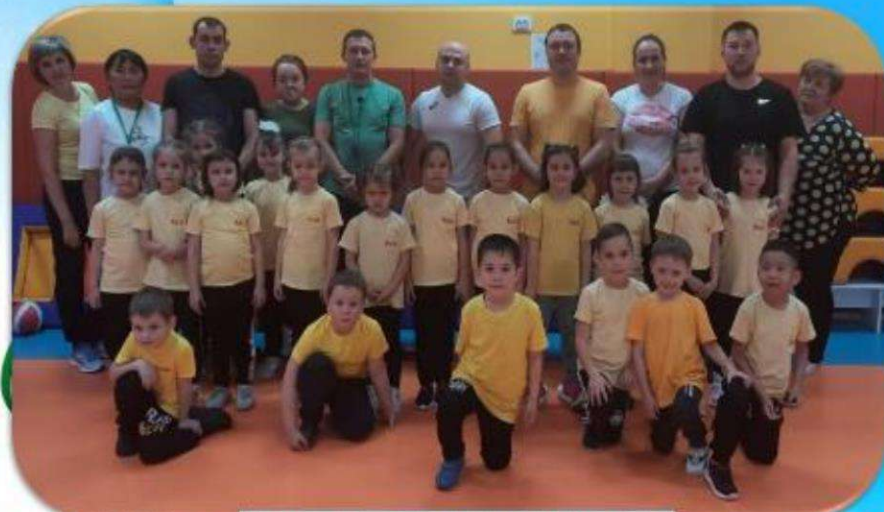
Подготовительная группа №1 «Лучики»

Команда: «Спортивные ребята» Девиз: «Все мы спортом заниматься любим с самого утра! И приветствуем, ребята, громким вас «Физкульт-ура»