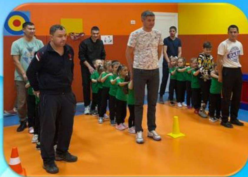
Средняя группа №2 «Пчелки»

Мероприятие направлено на привлечение внимания к значимости роли отца в семье, популяризацию семейных ценностей.