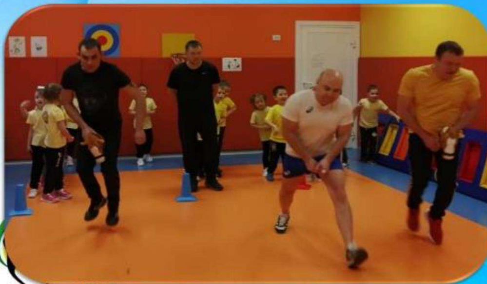
Наши папы молодцы, наши папы удалцы!