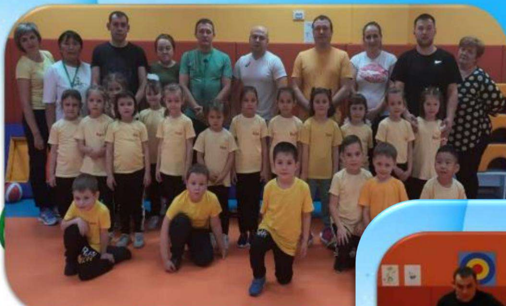
Подготовительная группа №1 «Лучи»

И приветствуем, ребята, громким вас «Физкульт-ура»