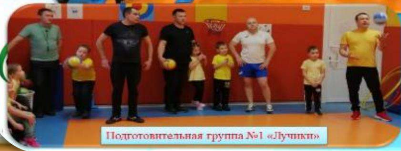
Подготовительная группа №1 «Лучики»