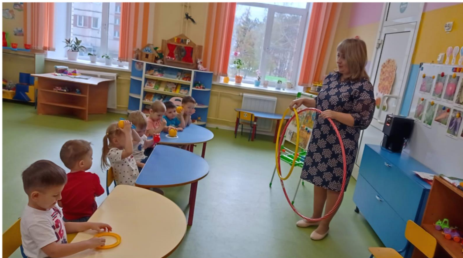
ФЭМП «Знакомство с кругом»