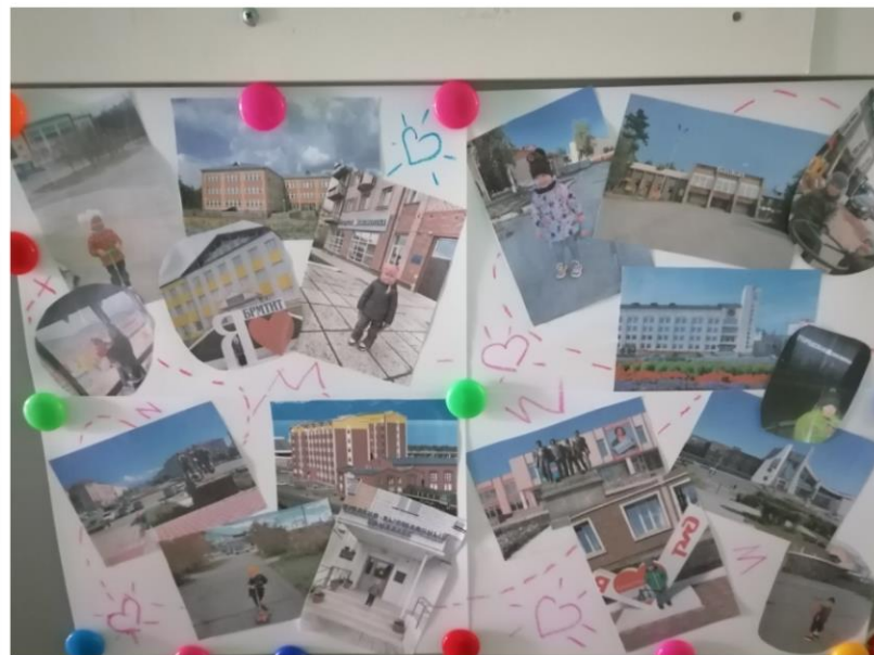
Фото коллаж «Здания моего города»