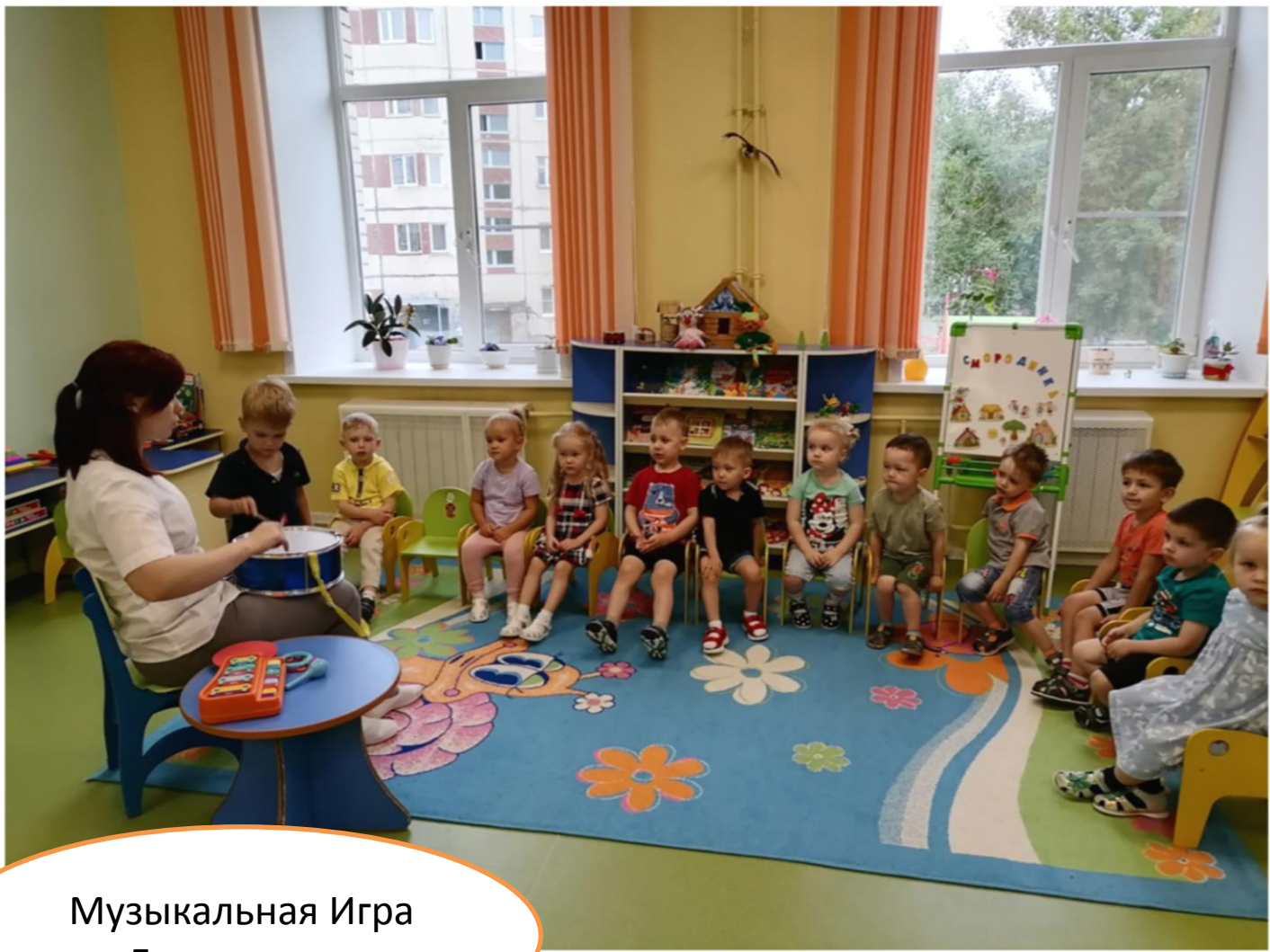
Музыкальная Игра «Громко тихо»