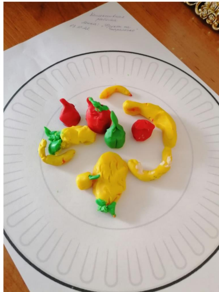
Лепка «Фрукты на тарелочке»