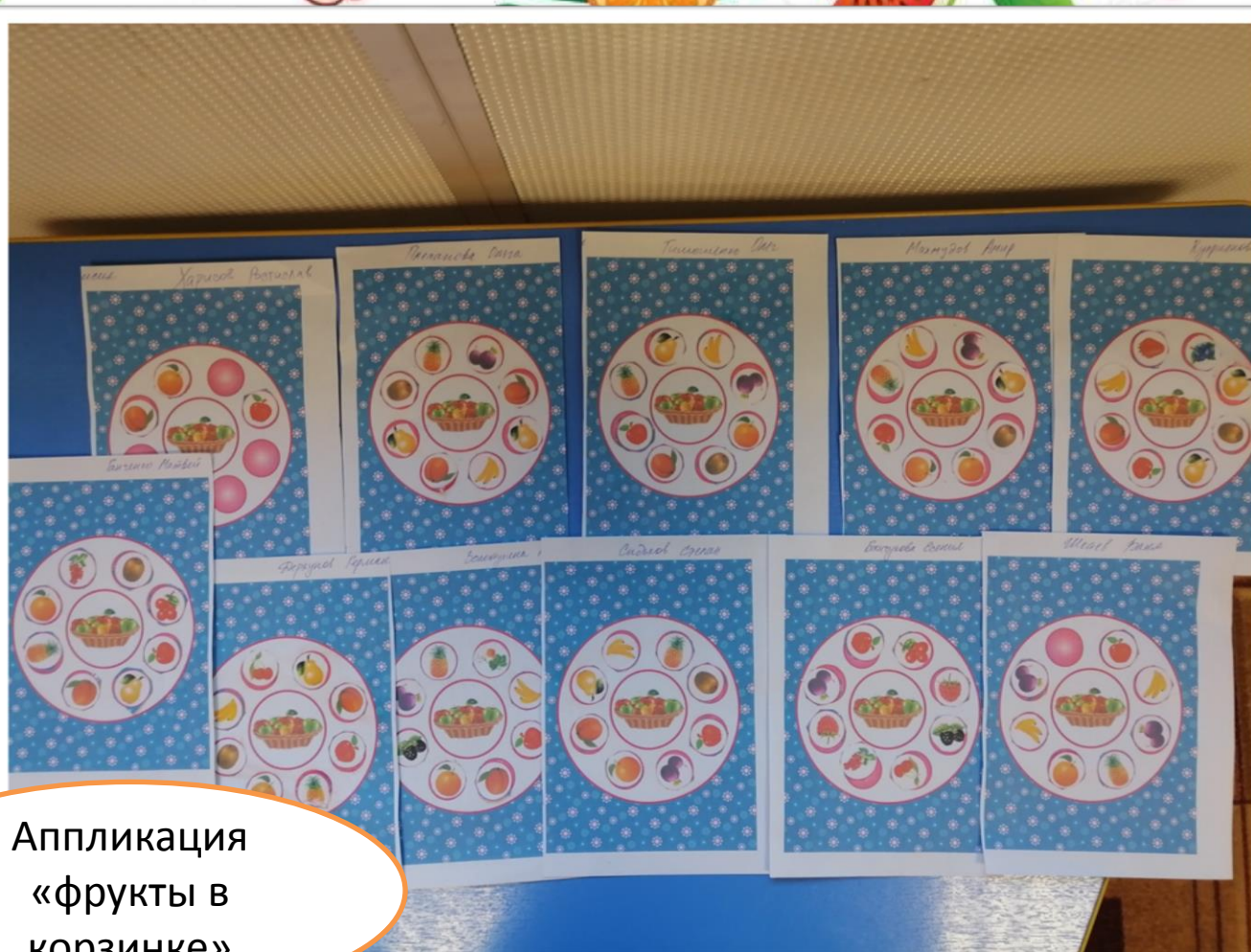
Аппликация «фрукты в корзинке»