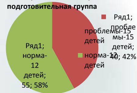
Физическое развитие сентябрь 2022г. подготовительная группа