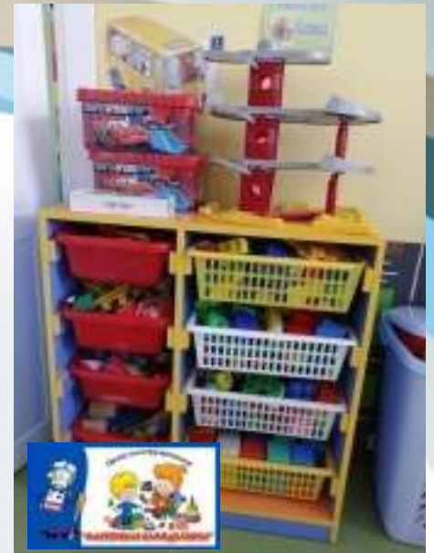
Центры активности группы