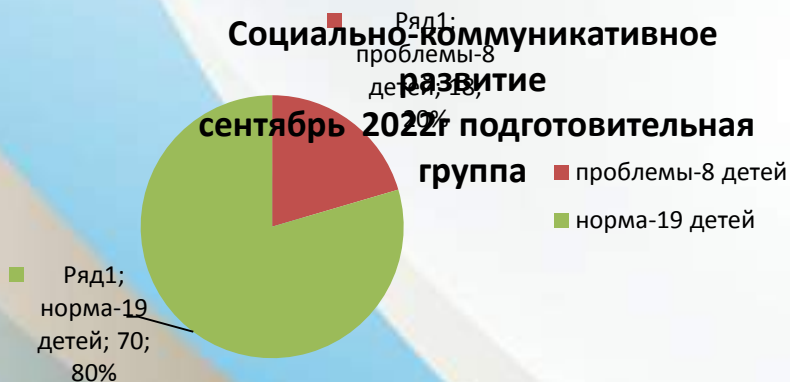
Социально-коммуникативное развитие сентябрь 2022г. подготовительная группа